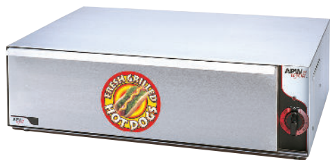
Model BW50 (shown)

Los calentadores de hermético APW Wyott brindan un calor suave para los insumos, manteniéndolos en una temperatura y textura ideales. Un cajón deslizante facilita el acceso a clientes y empleados. Los controles infinitos son fáciles de usar y establecen la temperatura óptima.